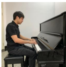
（钢琴演奏：须看到琴键、双手与侧脸）

（一）作曲、录音艺术专业面试画面示意图：电脑或手机“腾讯会议”、手机“一起练琴”、手机支架，所有设备不能移动。